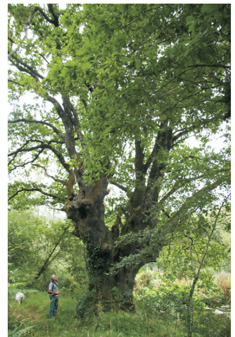
Carballo en Cancelos.