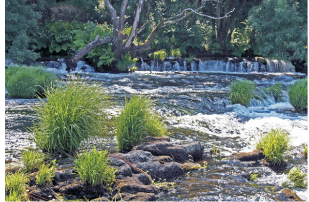
Balsa de Lens

Ruta lineal pola beira do Tambre, no concello de A Baña, entre a área recreativa de Fiofians e Portochán. Ideal para facer na primavera antes de que o mato cegue o carreiro. Permite gozar do discurrir lento do Tambre e dos espellos das balsas camiñando por fermosas carballeiras nas que destaca o carballo de Cancelos de case 6 m de perímetro. COMO CHEGAR: